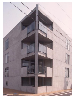
N's House 建物竣工: 2001年 設計監理: SOCIUS